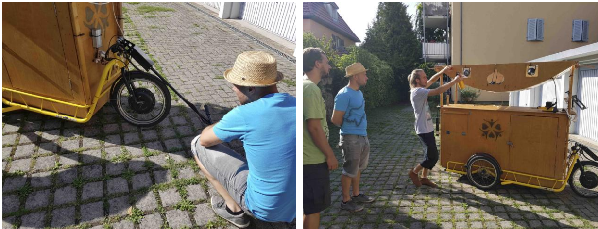
Besichtigung: Mobiles Lastenradsystem mit Solarzellen

Die Zuladung pro Lastenrad (mit elektrischem Antrieb) beträgt etwa 200 Kilo. Die Kosten für ein Lastenrad mit Greenpack Akku, Pedelec-System und Scheibenbremsen belaufen sich auf etwa 6.500,- Euro.