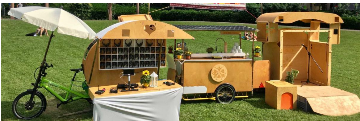
Beispiel: Veranstaltungsfahrzeug "New Heart Festival"

Neben der Fußgruppe ist ein ökologisches Begleitfahrzeug in Planung, welches mittels Solarenergie betrieben wird und die Aktionsmaterialien transportiert. Auf den Veranstaltungen wird das Solarmobil zur Bühne für Vorträge, Musikveranstaltungen, zu einem Open Air Kino und in eine rollende Disco umfunktioniert. Das Fahrzeug selbst und unsere Fußgruppe sollen andere Menschen begeistern und dazu anregen, über vermeidbare CO 2 Belastungen nachzudenken.